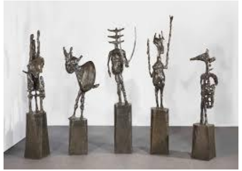
Beelden van Richier: met wat fantasie zie je er schaakstukken in.

Een andere aanrader is volgens Pieter Beelden aan Zee. Om daar het werk van Germaine Richier te zien moet je wel snel zijn: de tentoonstelling sluit 6 september.