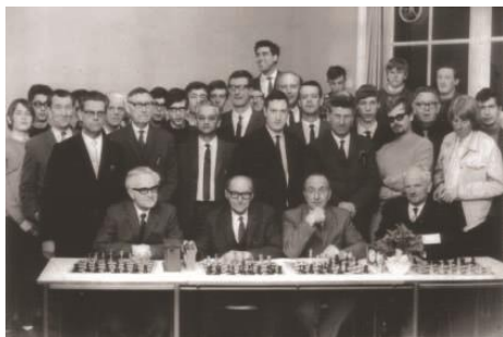
Schaakclub Nieuwendam omstreeks 1958