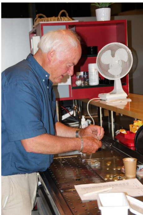
Let op uw centen !